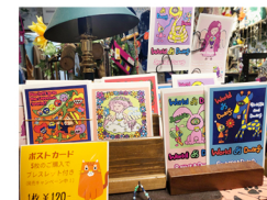
切り絵作家 WONDER WOODSさんの pauseオリジナルカード

雑貨屋パウゼ pause 板橋区大山町25-7 金子ビル2階 定休日：毎週火曜日（臨時休業あり） 営業時間：10:30~18:30 e-mail pause7w@gmail.com